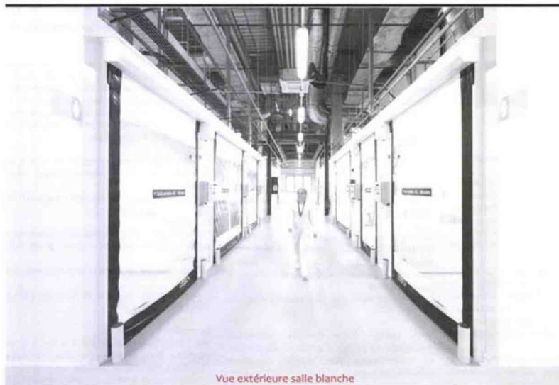
Vue extérieure salle blanche