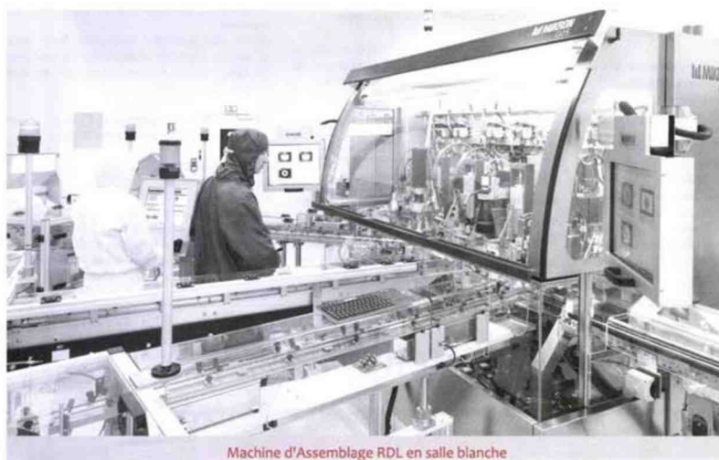
Machine d'Assemblage RDL en salle blanche

fermeture pour flacon RayDyLyo d'ARaymondLife (capsule prête à l'emploi tout plastique), constitue la première ligne de remplissage aseptique à usage unique, installable dans un environnement adapté aux besoins. La plateforme Accinov, dont l'objectif est d'offrir tous les attributs d'un grand groupe aux petites structures, de les aider en leur fournissant un environnement de qualité et l'accompagnement leur permettant d'accélérer le passage de la recherche à l'innovation technologique, va mettre à disposition des PME et startups ce nouveau dispositif.