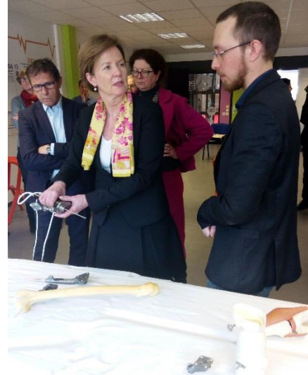
Démonstration de CARTIMAGE