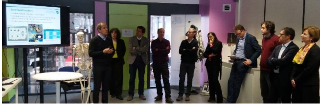
Démonstration de SURGIQUAL INSTITUTE