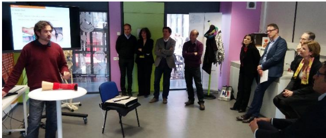
Démonstration de TEXISENSE