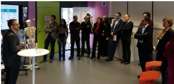
Présentation de MEDICALPS